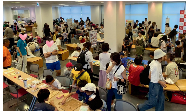
今年の夏祭りの様子。大盛況！

からふるでは活動をするうえで、『ご縁を大切にすること』をモットーにしています。メンバーそれぞれの色を大切にしながら、お互いに気持ちよく活動ができるよう、情報交換やSNSを使ったコミュニケーションなど、柔軟で幅広いネットワークの構築を心掛けているそうです。今後も、伊丹市内で子どもや子どもを支える大人たちが集う居場所づくりを行っている団体や個人と、さらに多く繋がり交流を深めていきたいとの思いがあります。