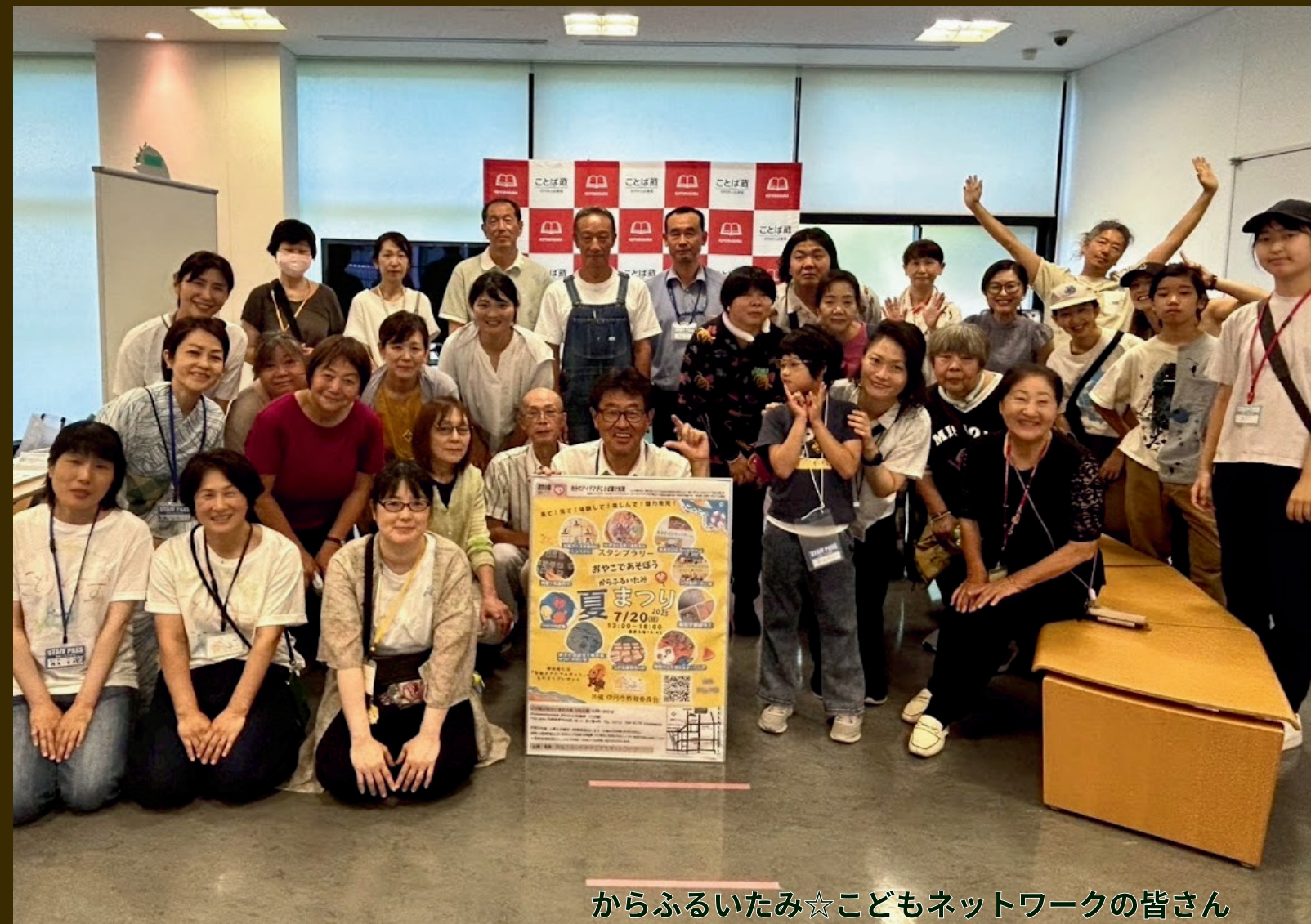
からふるいたみ☆こどもネットワークの皆さん