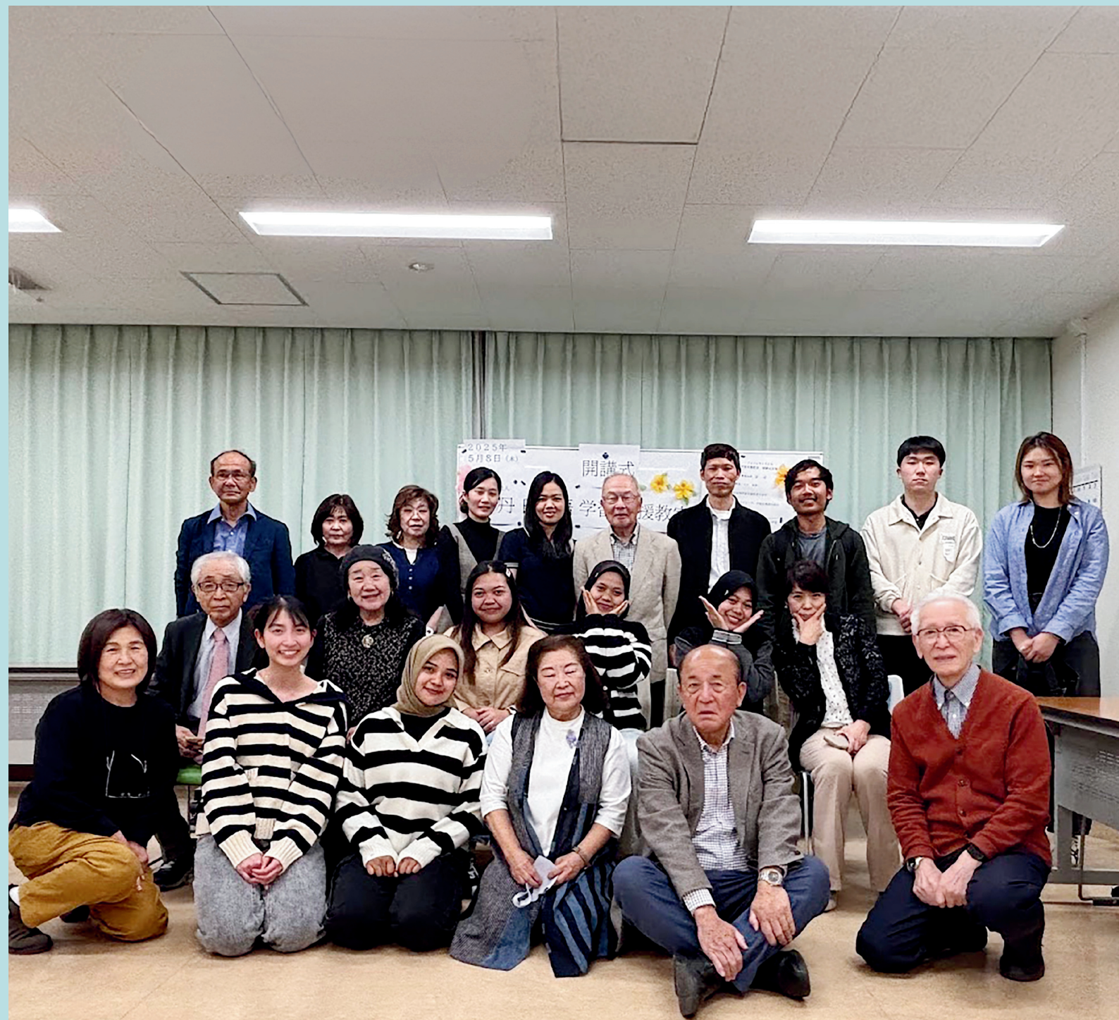
NPO法人「伊丹日本語学習支援教室」の皆さん